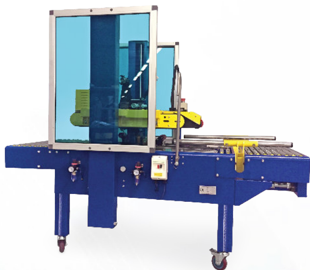
NASTROPACK NP 03 EV