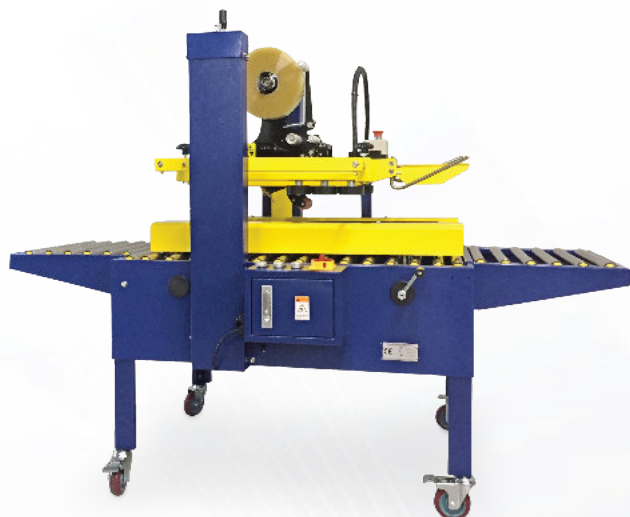
NASTROPACK NP 01 LC EV