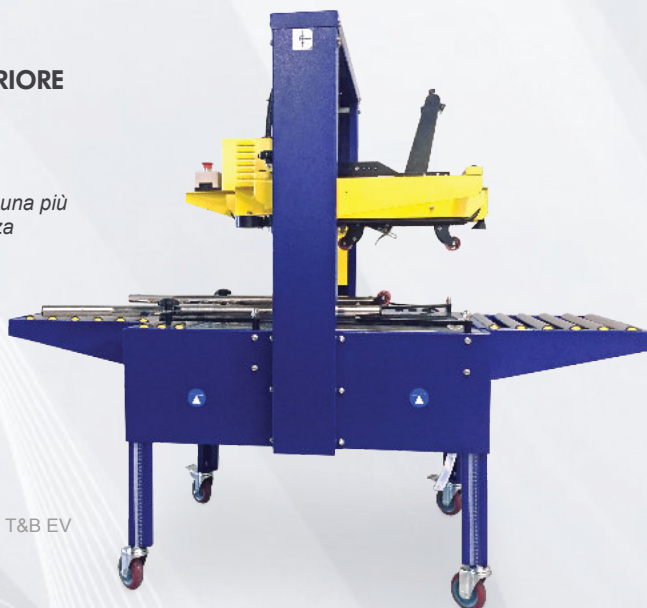
NASTROPACK T&B EV