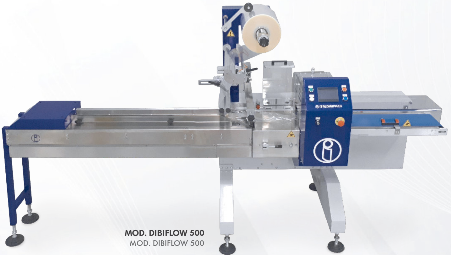
MOD. DIBIFLOW 500 MOD. DIBIFLOW 500